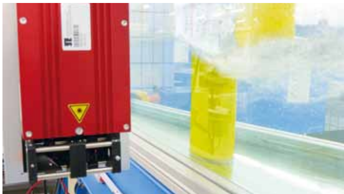
Strömungsmessung mit Lasersonde

drei Jahren das Studium an einer Fachhochschule aufnehmen. Im laufenden Jahrzehnt gelangen demographisch bedingt große Jahrgänge an die Hochschulen, und ein immer größerer Anteil eines Jahrgangs nimmt ein Studium auf. Als Folge des zwölfjährigen Abiturs und des Aussetzens der Wehrpflicht sind Studienanfänger deutlich jünger als noch im vergangenen Jahr. Die große Bandbreite an Eingangsqualifikationen und die große Studierendenzahl stellen die Hochschulen angesichts eines festen Qualitätsanspruchs beim Studienabschluss vor große Herausforderungen.