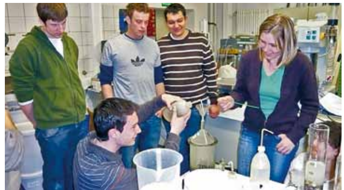
Studierende beim Baustofftechnologie-Praktikum

Die Vielseitigkeit des Berufs spiegelt sich in den Studiengängen wider. Der Bachelorstudiengang Bauingenieurwesen führt in sieben Semestern Regelstudienzeit zu einem ersten berufsqualifizierenden Studienabschluss. Die Ausbildung ist praxis-