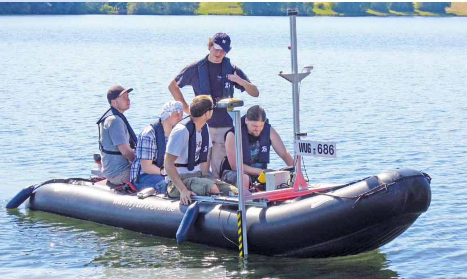
Studierende beim Praktikum - Messungen auf dem Brombachsee